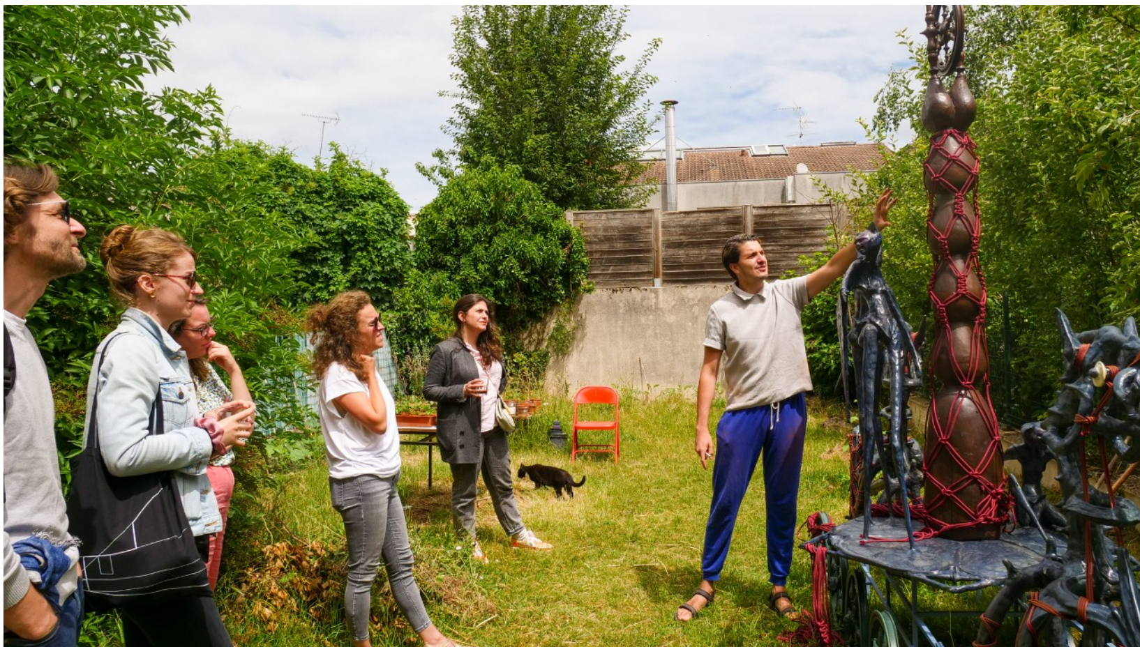
9 et 10 juin 2022 : Parcours Pro #5 dans le Loiret