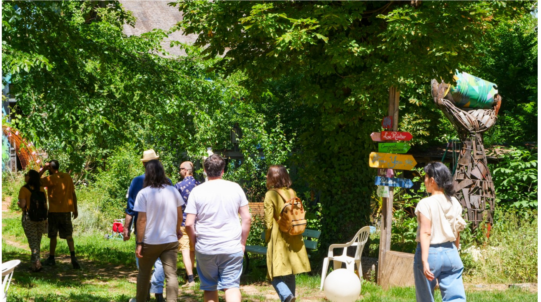
13 juin : visite-rencontre du Comité des Choses Concrètes à Bourges et du Cercle à Lunery (18).