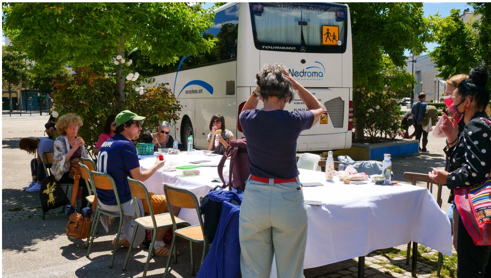
2 juillet 2022 : navette de l'art #5 & TaxiTram