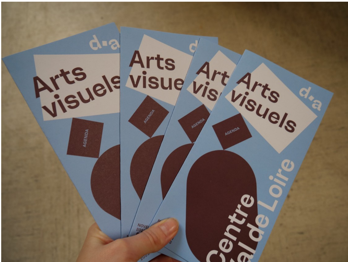
Novembre 2022 : Agenda arts visuels #1