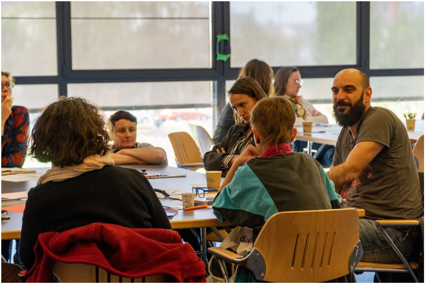
28 avril 2022 : Rencontres régionales des arts visuels · Issoudun Atelier Nos conditions animé par l'artiste V. Jourdain.